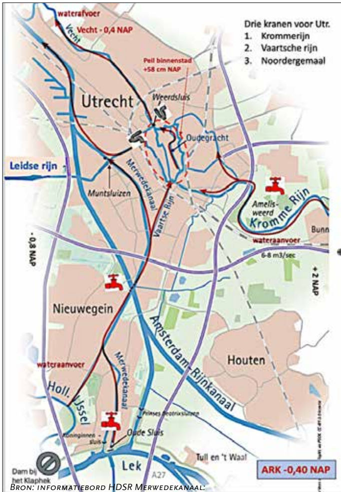
WATERKRANEN VOOR DE STAD UTRECHT

de Kromme Rijn zo'n zeven kubieke meter per seconde relatief voedselrijk water de stad in. Bij lage waterstand in de Lek kan via de Vaartse Rijn / Merwedekanaal bij de Oude Sluis in Nieuwegein extra water worden ingelaten (kraan 2). Bij extreme droogte pompt het Noordergemaal - bij de kruising van de Merwedekanaal met het Amsterdam-Rijnkanaal (ARK) – nog eens extra water uit het ARK het Merwedekanaal in, dat dan via de Vaartse Rijn bij het Ledig Erf de stad binnenstroomt. Het gemiddelde peil in het Merwedekanaal en de Vaartse Rijn is gelijk aan het peil in de singels (+58 cm t.o.v. NAP). Beide waterlopen hebben een open verbinding met de singels.