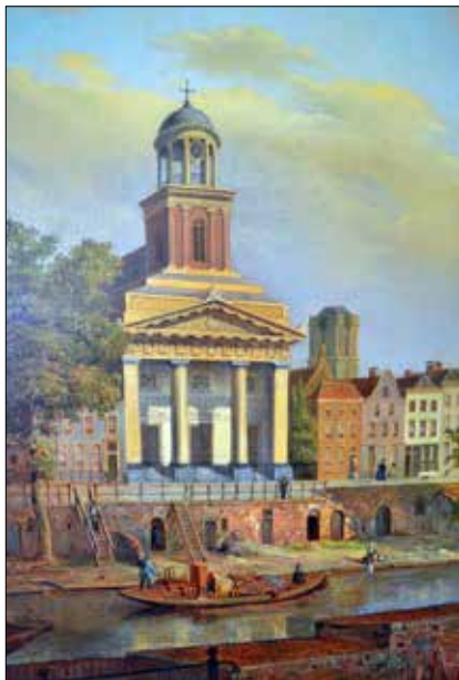
SINT AUGUSTINUSKERK IN 1840 DOOR THEODOOR SOETERIK

Op een schilderij van Theodoor Soeterik is de Augustinus in al zijn pracht te zien, met het karakteristieke groene