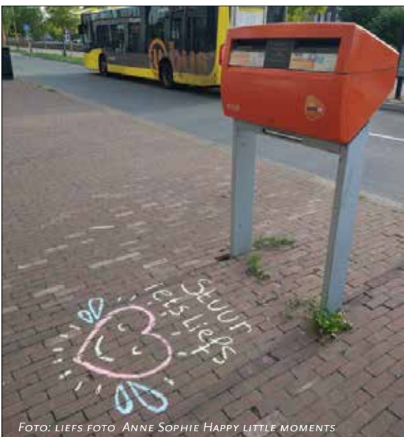
STUUR IETS LIEFS