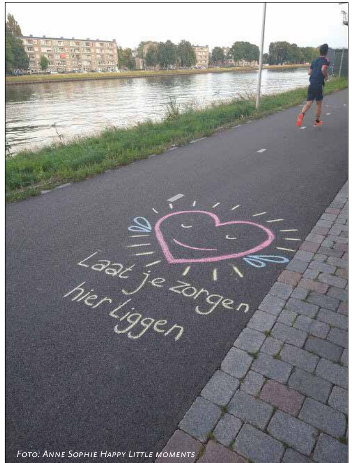
HAPPY LITTLE MOMENTS LAAT JE ZORGEN HIER LIGGEN

Omdat de wereld wel wat meer willekeurige daden van vriendelijkheid kan gebruiken, hierbij een aantal voorbeelden hoe je dit in de praktijk brengt. Het is namelijk heel simpel, een kind kan de was doen. Het gaat om kleine dingen die weinig energie kosten en vaak ook nog gratis zijn. Voor iemand de deur openhouden, een complimentje geven, een luisterend oor bieden, een kaartje sturen, de buurvrouw uitnodigen voor een kop koffie. Het lijkt misschien klein of onbeduidend, maar dat is zeker niet zo. Het kan iemands dag goedmaken. Uit de diverse studies die hiernaar gedaan zijn, blijkt keer op keer dat regelmatig iets goeds doen voor een ander zonder er iets voor terug te verwachten je eigen geluksgevoel significant doet stijgen. Een win-winsituatie dus, want zowel de gever als de ontvanger ondervinden een stijging in geluksgevoel. Belangrijk is wel om het niet bij één keer te laten, maar regelmatig zomaar iets aardigs te doen.