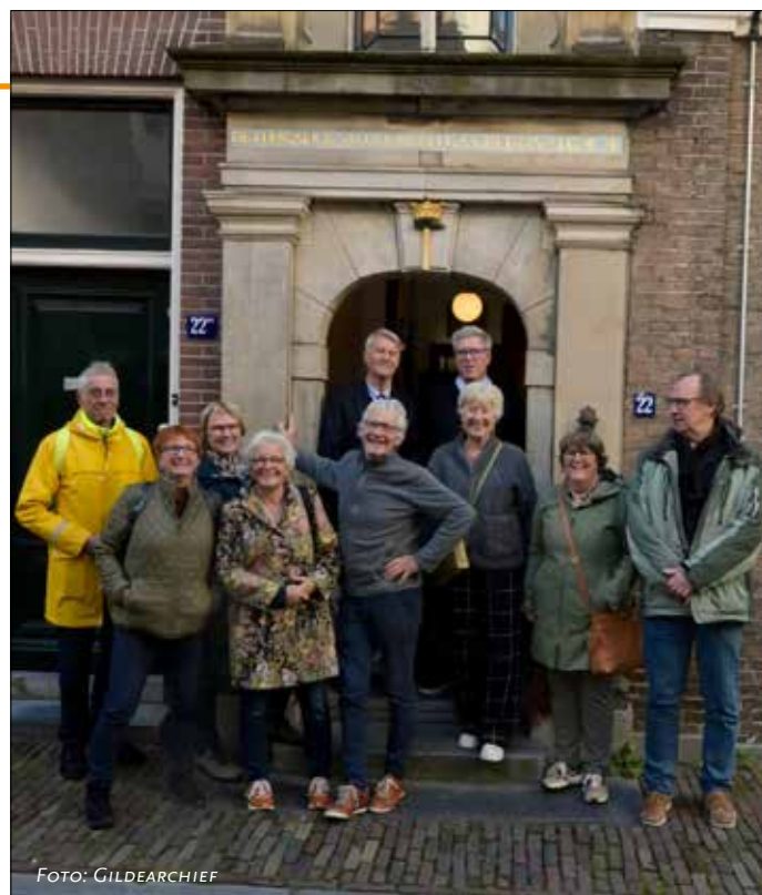
INTERVISIEGROEP BIJ HET SINT ELOYEN GASTHUIS

Maar een enkele keer kiezen we een andere invulling. Vorig najaar zijn we met zijn allen naar het Oudheidkundig Museum in Leiden geweest omdat daar een mooie expositie was met als thema Het Jaar 1000. Met veel materiaal uit Utrecht. Afgelopen maand konden we zomaar terecht bij het Sint Eloyen Gasthuis. Deze ervaring was echt super. Een heel gastvrije ontvangst door twee 'broeders', een boeiende inleiding, een rondleiding door het pand en ongelimiteerd tijd om vragen te stellen. En voor de liefhebbers onder ons ook nog tijd voor een echt partijtje kolf. Deze keer natuurlijk geen feedbackronde, maar we hebben tijdens de lunch rustig nagekletst over dit bezoek. Wat was nieuw? Wat kunnen we ermee? Dus geen intervisie volgens het boekje, maar wel een heel leerzame ervaring. Een aanrader!