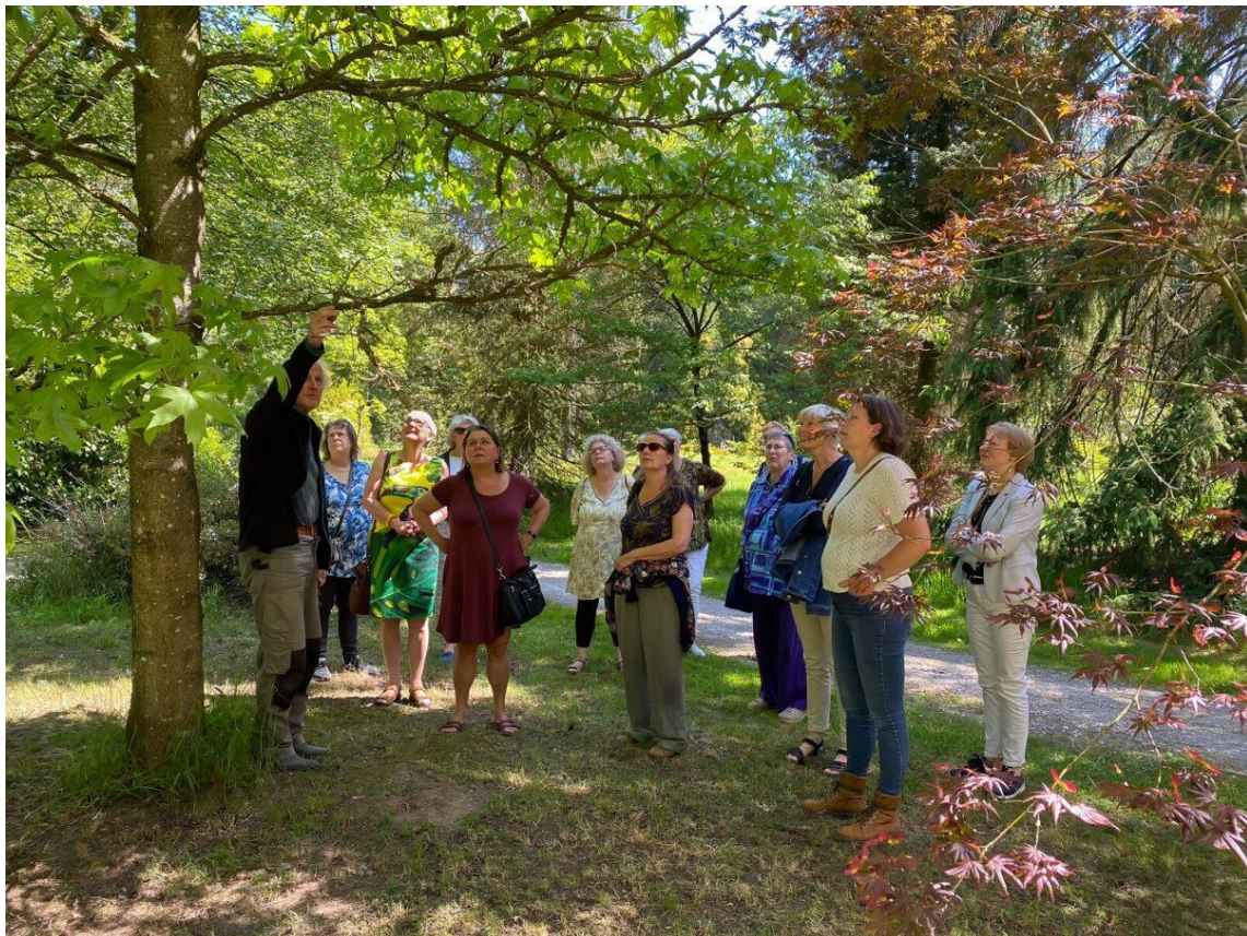
Balieuitje naar het Arboretum in Doorn

Gilde Utrecht streeft ernaar om bij alle activiteiten een situatie te creëren die veilig voelt voor zowel deelnemer als vrijwilliger. We houden rekening met de wensen van zowel vrijwilligers als deelnemers bij bemiddeling; met name bij de taalondersteuning is dit van belang. Ons vrijwilligersbeleid is vastgelegd in het document Ieder zijn waarde , dat elke nieuwe vrijwilliger krijgt. Hierin is ook een klachtenprocedure opgenomen en beschreven hoe gehandeld wordt in geval van een geschil. Sinds 2022 werken we ook met een gedragscode die elke nieuwe vrijwilliger ondertekent. Belangrijk is dat er onmiddellijk gehandeld wordt als er zich een situatie voordoet die voor de vrijwilliger of de deelnemer onveilig aanvoelt. Degene die zich in de situatie bevindt moet altijd het gevoel krijgen serieus te worden genomen en gehoord te worden. Dat klinkt wellicht als een open deur, maar in de praktijk is gebleken dat door het zo aan te pakken het probleem al voor een groot deel opgelost is.