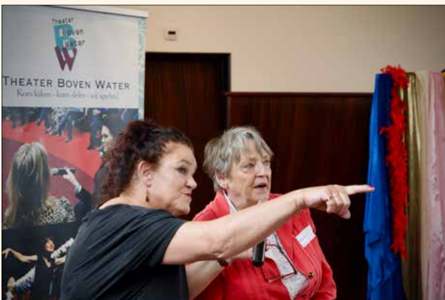
GIDS ELS JIMKES VERTELT HAAR GILDEVERHAAL