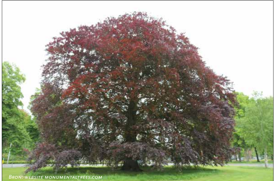
RODE BEUK EMMALAAN IN BETERE TIJDEN

Zo zijn er veel meer bomen met een verhaal. In een oud manuscript wordt bijvoorbeeld vermeld dat een extract van het blad van de Anna Paulownaboom voorkomt dat de huid gaat rimpelen en het haar grijs wordt. Ook gaat het verhaal dat de vruchten van de moerbeiboom je kunnen genezen van een slangenbeet, een keelabces of spierpijn.