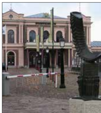
Spoorwegmuseum Maliebaanstation 16