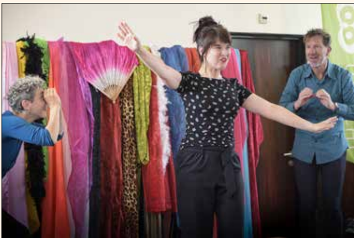
THEATER BOVEN WATER SPEELT DE 'DOMTOREN'